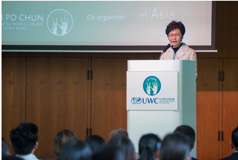
香港特別行政區行政長官林鄭月娥為研討會正式掀開序幕